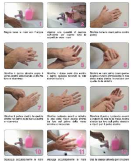
FM07 Dimensione 200x300 mm. FM08 Dimensione 333X500 mm.

La durata del processo è di circa 60 secondi