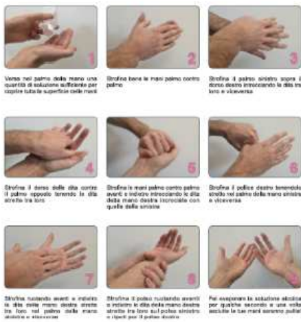
FM05 Dimensione 200x300 mm. FM06 Dimensione 333X500 mm.

La durata del processo è di circa 30 secondi