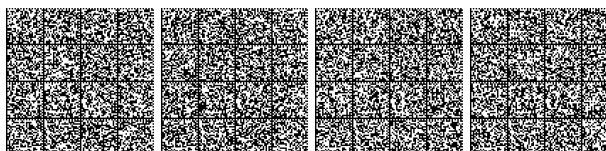
Tabella V.5- 3: Livello di prestazione per controllo dell'incendio